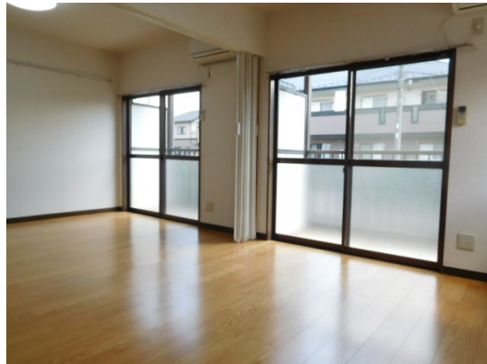
図面と現況が異なる場合は現況が優先となります。